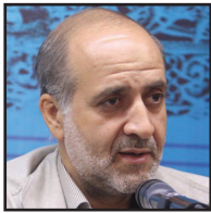
عبا گذاری چند مداح جوان در اجلاس پیر غلامان