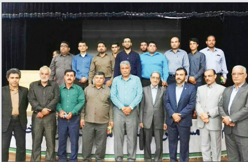
اولین جلسه مدرسه دعبل استان بوشهر برگزار شد