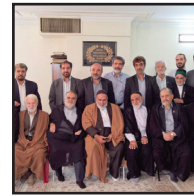
دیدار با پیر غلامان اهل بیت