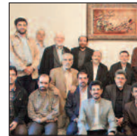
دیدار با پیر غلامان اهل بیت

فصلنامه دعبل - برگزیده مطالب پایگاه اطلاع رسانی دعبل - پیش شماره دوم، تیرماه ۹۵