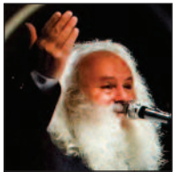
استاد جابر عناصری در گذشت