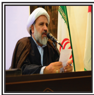
بعثه مقام معظم رهبري اعلام کرد:

آغاز نام نویسی آزمون مداحان عتبات از ۲۲ دی ماه