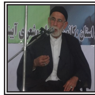
حد وارد شدن جامعه مادحین در انتخابات از زبان حاج غلامرضا سازگار:

آغاز نام نویسی آزمون مداحان عتبات از ۲۲ دی ماه