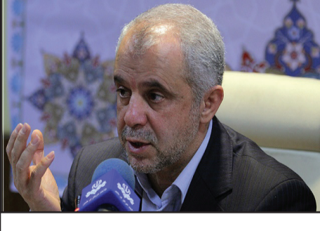
رئیس سازمان حج و زیارت گفت: هرگونه تصمیم‌گیری شرعی درباره حج تمتع منوط به نظر ولی امر مسلمین و مراجع عظام تقلید است.

وی گفت: ۱۶ پیکر باقیمانده در دو یا سه روز آینده وارد کشور