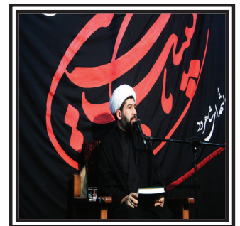
حجت الاسلام والمسلمین وافی: مخاطب شناسی کلید کار مداحان