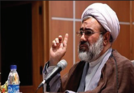
اولین هم‌اندیشی مسئولین و اعضای ستاد ساماندهی شئون فرهنگی در مناسبتهای مذهبی استان تهران برگزار شد.