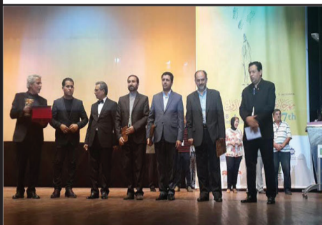
فیلم «رستاخیز» به کارگردانی احمدرضا درویش جایزه بزرگ جشنواره بغداد را دریافت کرد.

هفتمین جشنواره بین‌المللی فیلم بغداد ۱۳ مهرماه با اعلام برگزیدگان به کار خود پایان داد و جایزه بزرگ این فستیوال به فیلم «رستاخیز» تعلق گرفت.