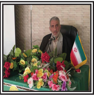
مداحان از منابع معتبر استفاده

خبرنامه هفتگی دعبل - برگزیده مطالب پایگاه اطلاع‌رسانی دعبل - شماره شصت و ششم، ۲۶ شهریور ۹۴