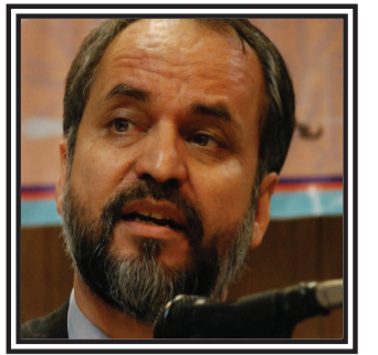
مبارزه با افراط‌گرایی هدف ستاد سامانه‌های فرهنگی شنون مذهبی